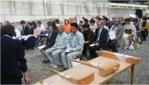
開催を待つ人たち。

10月8日、司教様をお迎えして、起工式が10月らしい快適な天候のもと、行われました。