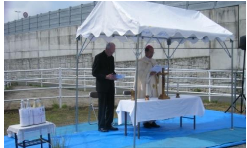
司教様とマヘル神父様がお揃いに。